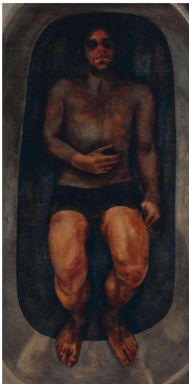
Romain_Le_bain - tempera et huile sur panneau - 70 x 140 cm